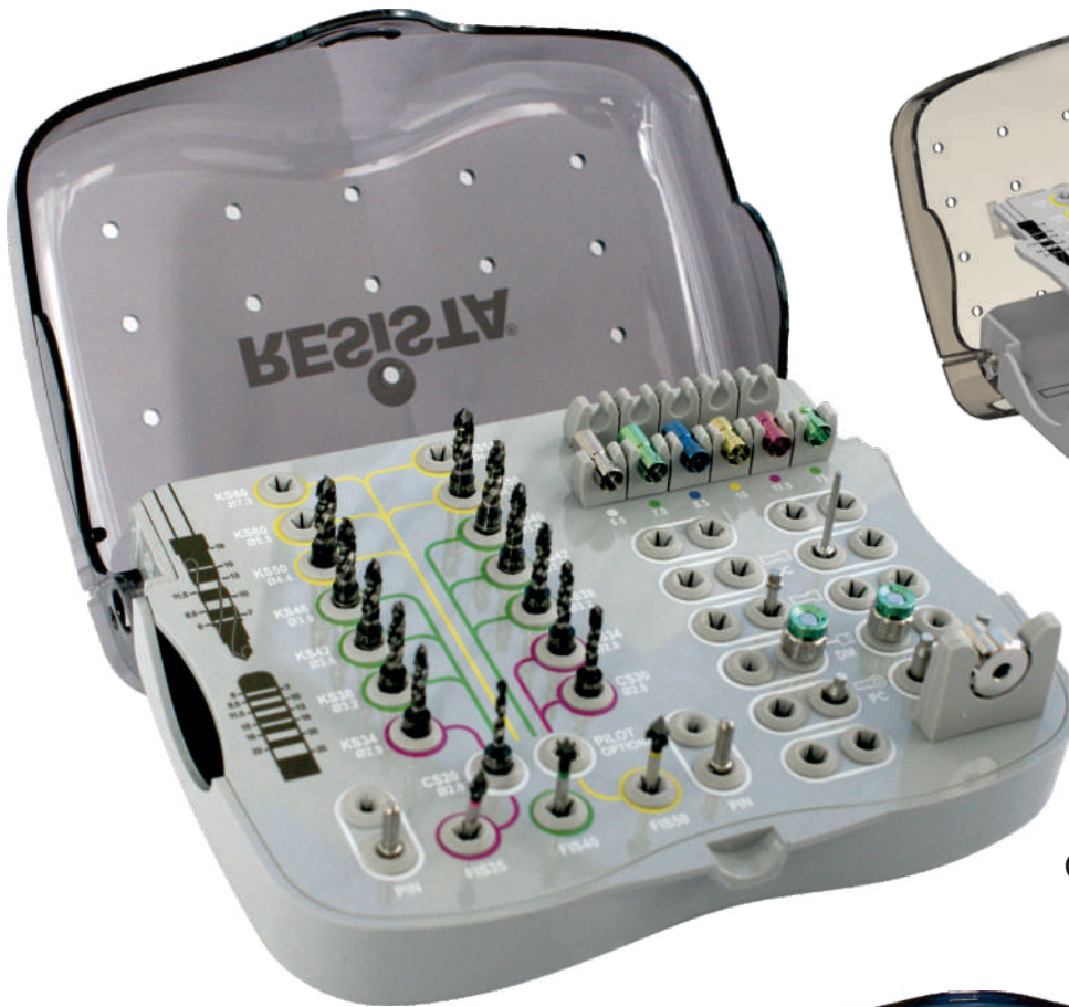
BOX 02 Solo contenitore