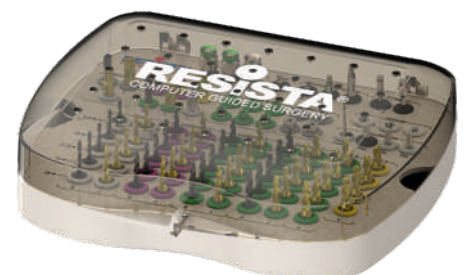
Vista Box Chiuso