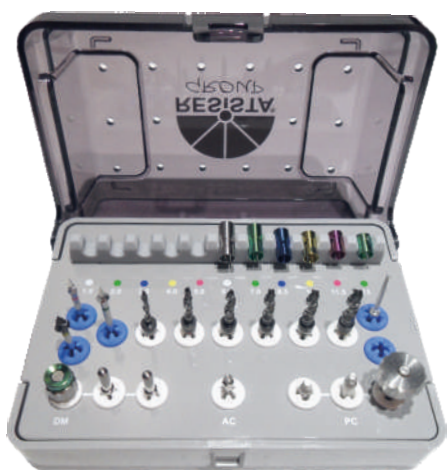
KIT 001 Monolinea