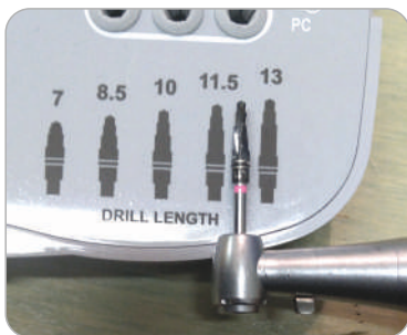
KIT FC Calibrate K