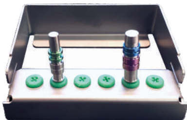
KBS Kit Boccole Spaziatrici REVO