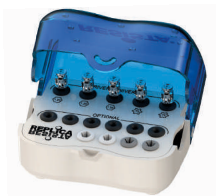
Kit Protesico REPLICA